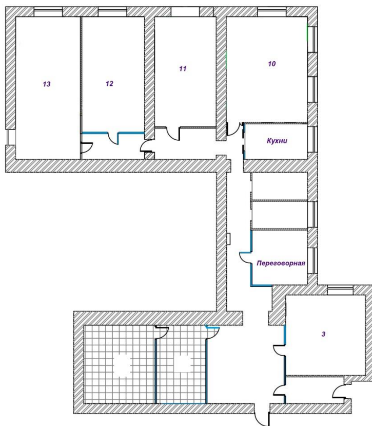
Схема расположения рабочего места по адресу: г. Санкт-Петербург, Аптека́рский просп., д. 2, лит. 3, пом. 7-Н (2 этаж)

№ _____ от «__» _____ 20__ г. (стр. 3 из 3)