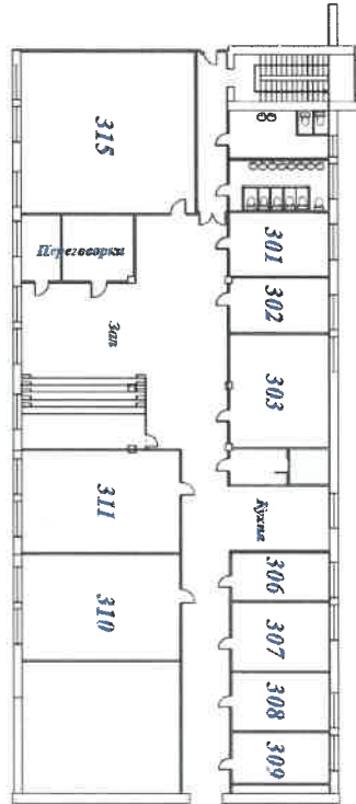
Схема расположения рабочего места по адресу: г. Санкт-Петербург, пр. Медиков, д. 3, лит. А, пом. 1-Н (3 этаж)

№ _____ от «__» _____ 20__ г. (стр. 2 из 3)